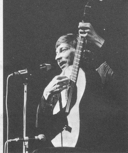
Dès sur scène.