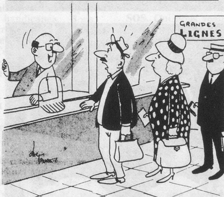
— Mais, bien sûr !... Il y a un tarif moins cher qu'en deuxième classe... mais pour cela il vous faut une muselière !... (Dessin de Faure - Cosmopress)

Elles auront lieu du mardi 19 au vendredi 29 octobre 1976 à l'Hôtel Luna, à Ascona. Pour tous renseignements, veuillez vous adresser au bureau cantonal, rue Saint-Pierre 26, 1er étage, 1700 Fribourg, tél. (037) 22 41 53.