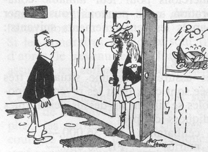
— Devine ce qui est arrivé au réverbère au coin de la rue ? (Dessin de Faure - Cosmopress)

Comptoir Suisse Lausanne 11 - 26 septembre 1976