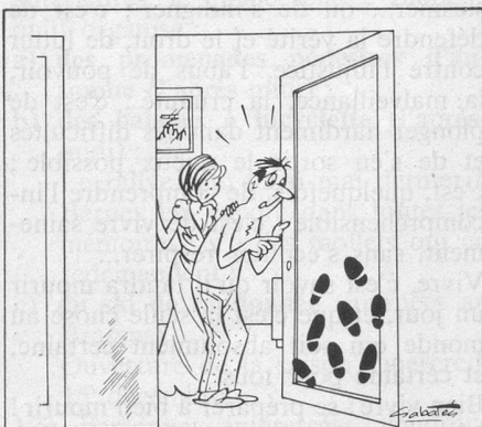
— Notre voisin est venu hier soir rouspéter pendant notre petite fête ! (Dessin de Sabatès.)

Réponse. Les règles et usages locatifs du canton de Vaud prévoient qu'il est interdit d'incommoder les voisins