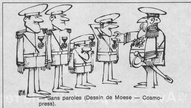
Sans paroles (Dessin de Moese — Cosmopress).