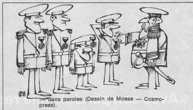
Sans paroles (Dessin de Moese — Cosmopress).