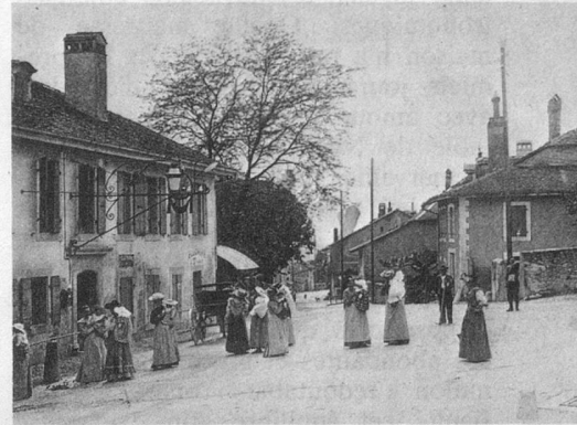
Bursins en 1907.