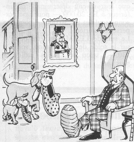
Sans paroles. (Dessin de Clew - Cosmopress.)