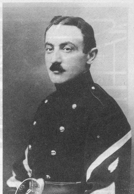
Agénor Parmelin, aviateur, vainqueur du Mont-Blanc, né à Bursins le 8 janvier 1884, tué à Varèse (Italie) le 28 avril 1917 au cours d'un vol d'essai.

Pourtant, les journaux parlaient quelquefois des exploits accomplis par des hommes qui, à l'étranger et même en Suisse, avaient grimpé haut dans le ciel et parcouru de grandes distances. On apprit même, un jour, que l'aviateur Agénor Parmelin, un « Genevois », parti du bout du lac, avait passé par-dessus le Mont-Blanc à 5540 mètres d'altitude pour aller atterrir à Aoste, en Italie, le 11 février 1914. Les journaux parlèrent avec enthousiasme de cette performance. Or, tous les Parmelin, quel que soit leur domicile, sont originaires de Bursins et l'on se souvint qu'Agénor y était né, qu'il y avait vécu sa première enfance et qu'il y avait de la parenté. Toute la population du village, instituteur en tête, voulut manifester sa joie et sa fierté. Pour bien montrer à ces « blagueurs de Genevois », et à tout le pays, que Parmelin était un Vaudois de Bursins, la Municipalité organisa une réception qui eut lieu un dimanche. On accrocha des drapeaux aux fenêtres, la jeunesse tressa des couronnes de mousse qu'on tendit à travers la rue principale. Musique en tête, bannière déployée, on fit en cortège le tour du village, avec collation devant la pinte du haut où des