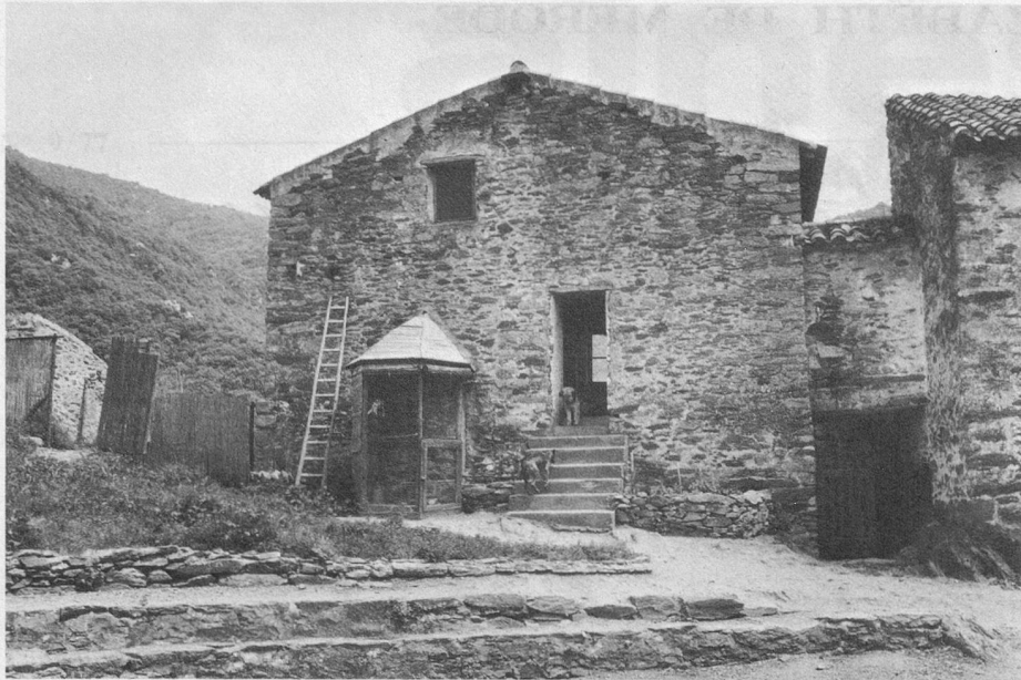
Grâce à ses nouveaux propriétaires, l'antique village de Montalba revit. Les de Mérode consolident les murs en respectant les vieilles pierres et aménagent les locaux.