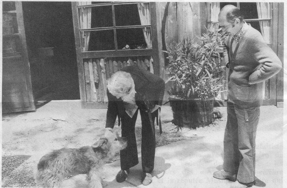
Devant la porte de leur petit restaurant où, entre autres spécialités, on déguste des pâtés et des tommes fabriqués sur place...

tude avant que ses nouveaux propriétaires ne le raniment en réparant les immeubles, en créant un petit restaurant et en participant à la réfection d'une route goudronnée d'un bout à l'autre et qui, en huit kilomètres de lacets, mène à Amélie, au fond de la vallée du Tech.