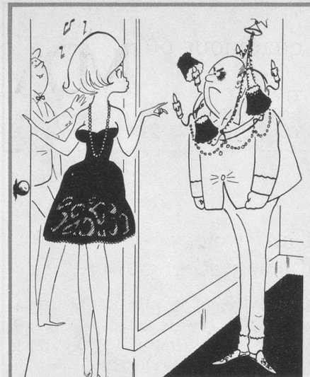
— D'abord, êtes-vous le voisin de dessus ou celui de dessous ? (Dessin de Caillé-Cosmopress).

La fédération a des projets. Elle se propose, dans les mois à venir, d'instaurer des séminaires d'information et de formation pour les responsables des clubs et leurs collaborateurs et de créer un centre de documentation sur les différents divertissements et le matériel audio-visuel à la disposition des clubs. J. M.