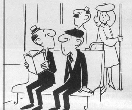
— Vous n'avez pas un autre livre ?... J'ai déjà lu celui-ci ! (Dessin de Padry-Cosmopress).