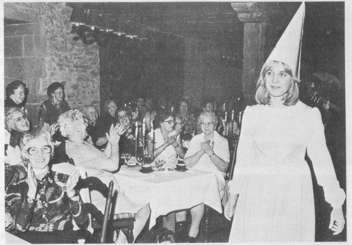
Les soirées au château.

Dans un cadre unique, création de la pièce de H.-Ch. Tauxe (texte) et Robert Mermoud (musique). A l'entracte banc de « merveilles », spécialités préparées par les dames du Jorat !