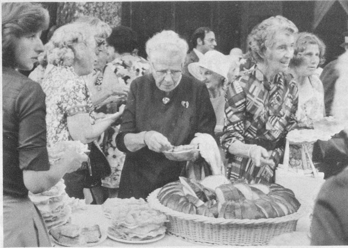
Les « merveilles » des dames du Jorat.