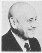
par Jean Nohain

Je viens de rendre visite pour vous, chers aînés, à une de nos plus vieilles amies de Paris: je suis allé faire trois petits tours sur la Tour Eiffel.