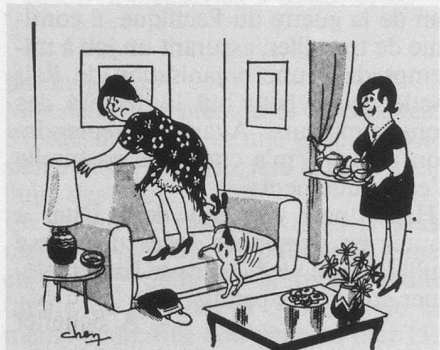
— C'est jeune, ça ne pense qu'à jouer... (Dessin de Chen-Cosmopress)