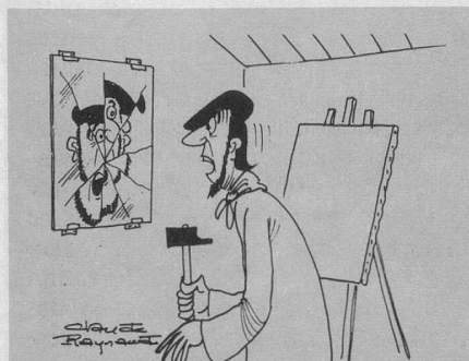
— Nom d'un chien!... J'ai découvert le procédé de Picasso! (Dessin de Raynaud-Cosmopress.)

Proportion de plus de 65 ans par rapport à la population totale :