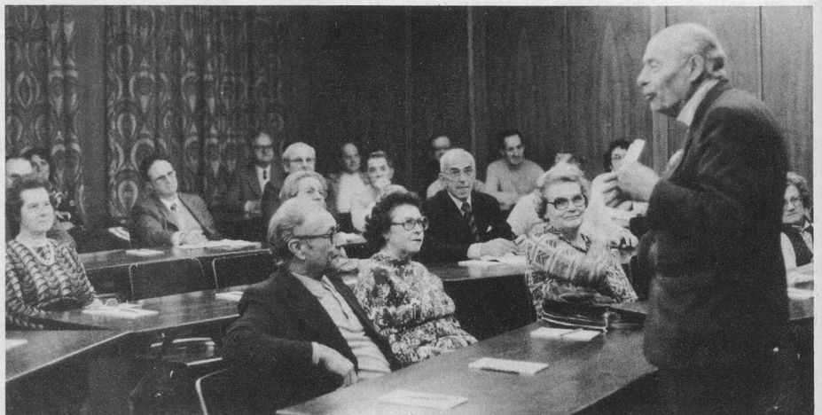
Le Dr Paul Tournier, écrivain: « A 80 ans, je me sens encore en pleine forme... »