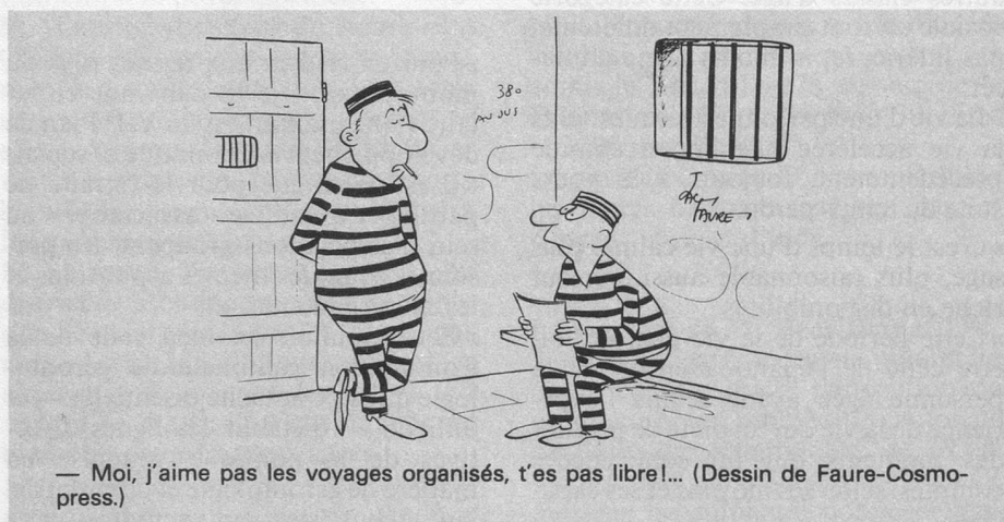
— Moi, j'aime pas les voyages organisés, t'es pas libre!... (Dessin de Faure-Cosmo-press.)

Toute personne qui rend visite à Pro Senectute est bien reçue. Mais si elle a