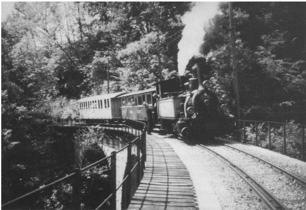
Blonay-Chamby, le petit train de la joie.