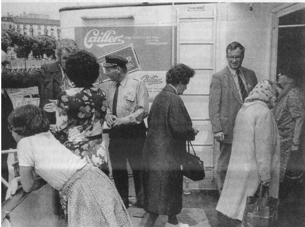
Le président D.-F. Ruchon accueille ses invités.

Genève , 3, place de la Taconnerie (022) 21 04 33 Lausanne , 49, rue du Maupas (021) 36 17 21 La Chaux-de-Fonds , 27, rue du Parc (039) 23 20 20 Bienne , 8, rue du Collège (032) 22 20 71 Delémont , 49, avenue de la Gare (066) 22 30 68 Tavannes , 4, rue du Pont (032) 91 21 20 Fribourg , 26, rue Saint-Pierre (037) 22 41 53 Sion , 3, rue des Tonneliers (027) 22 07 41