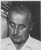
par Louis Perrochon