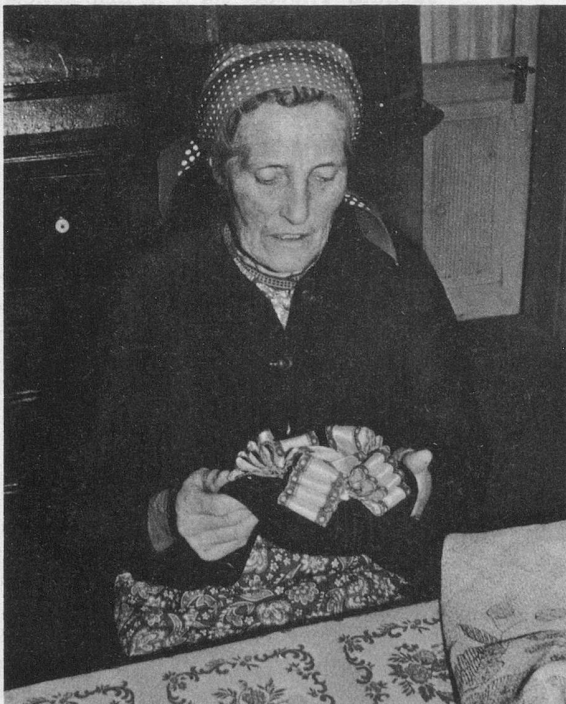
Ces chapeaux anniviards, ces broderies, c'est pour l'église.

— Il rendait souvent visite à des amis qui faisaient un retour à la nature, et il me regardait travailler. Un jour il m'a demandé si notre coin de terre suffisait à entretenir vingt vaches. Alors il m'est venu le rire et j'ai répondu: «Si on n'avait que ça à faire, on n'aurait rien à faire!» Un autre jour, on a