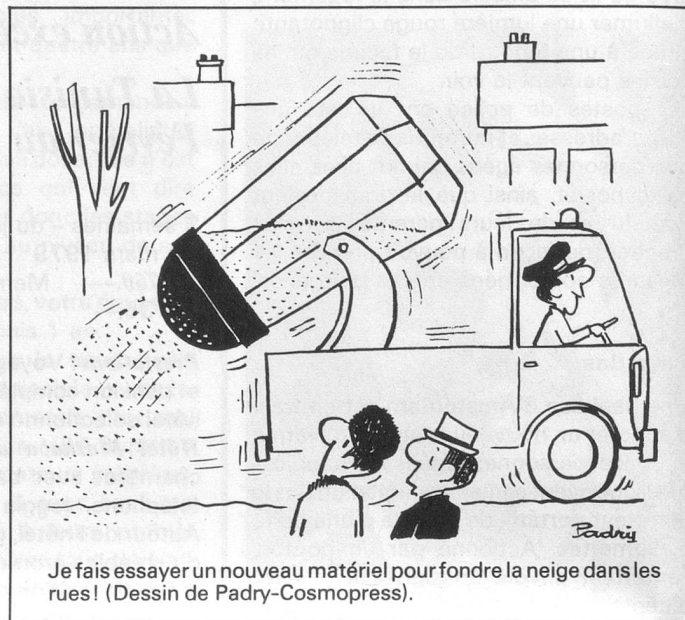
Je fais essayer un nouveau matériel pour fondre la neige dans les rues! (Dessin de Padry-Cosmopress).