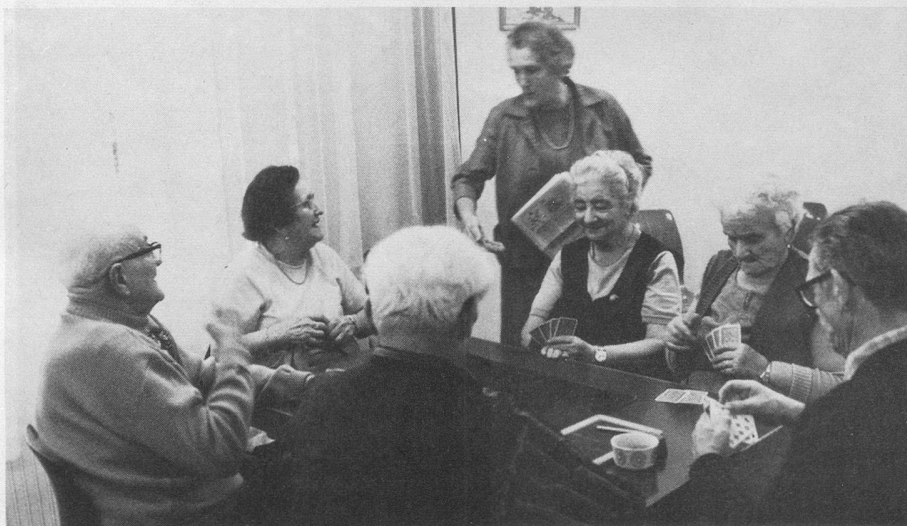
Dans les nouveaux locaux du club de Carouge, une table de champions.