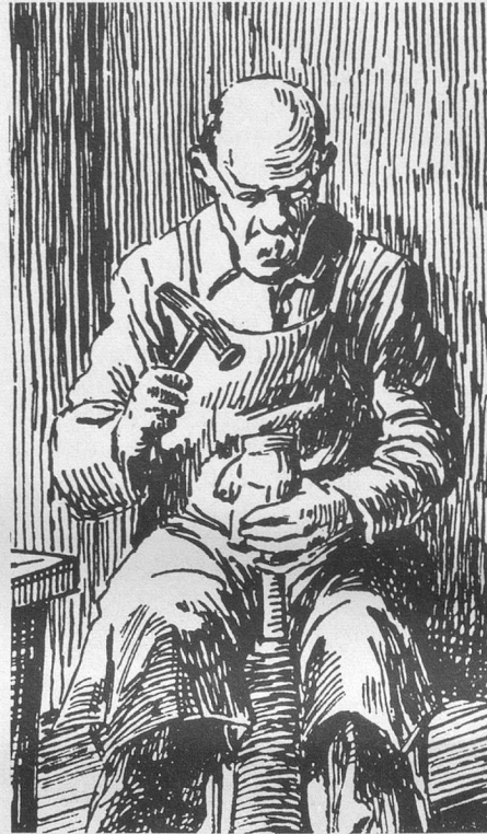
Le cordonnier (extrait de « Terre où j'ai vécu », Illustration de David Burnand, Editions Attinger, 1931).

Ma mère me donnait quatre sous et je partais en courant jusqu'à Gilly où se trouvait un cordonnier qui, probablement pour varier son travail, consentait à me tondre.