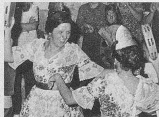
Bienvenue à Amélie-les-Bains, du 25 octobre au 8 novembre