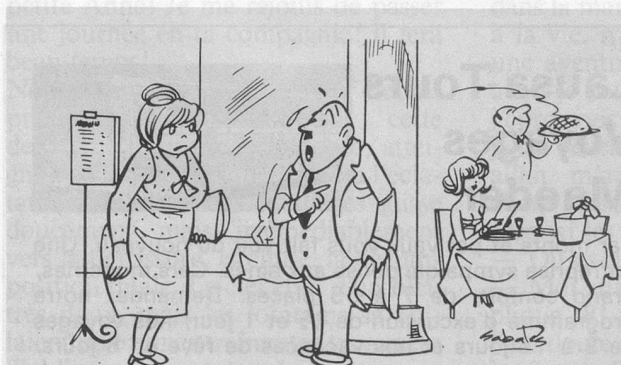
— C'est... la... secrétaire de mon patron. Je l'ai invitée pour qu'elle appuie ma demande d'augmentation... (Dessin de Ramon Sabatès)