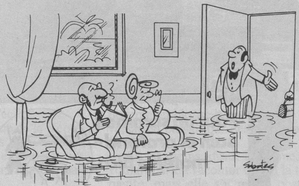
— Monsieur le plombier! (Dessin de Ramon Sabatès)