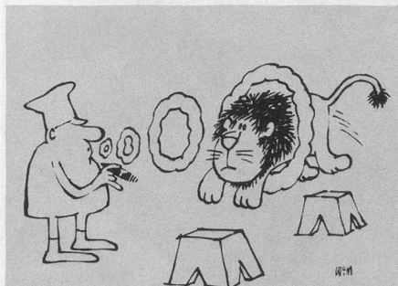
Sans paroles (Dessin de Moese-Cosmopress)