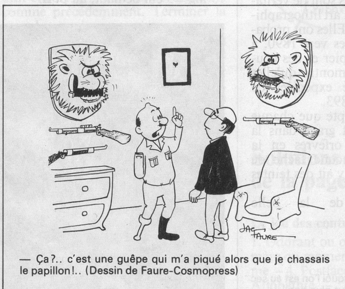
— Ça?... c'est une guêpe qui m'a piqué alors que je chassais le papillon!.. (Dessin de Faure-Cosmopress)

Vends, pour personne âgée , vêtements, lingerie et chaussures. Très bon état, bas prix, ainsi qu'une commode avec miroir. Tél. 039/44 13 62.