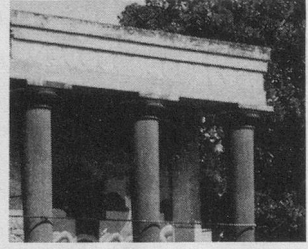
Avec « Ainés », séjour printanier en Grèce (30 avril au 11 mai 1980)