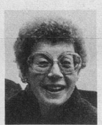
D'une génération l'autre, de Sophie à Geneviève