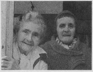
« Les Madivonnes » de Vogüé