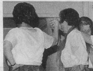
15 ans de gym 3 dans le canton de Vaud