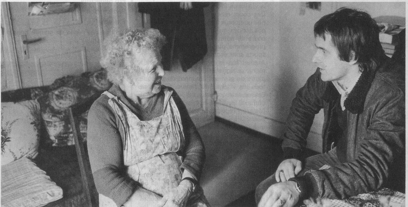
« Les hypothèques et les impôts... »