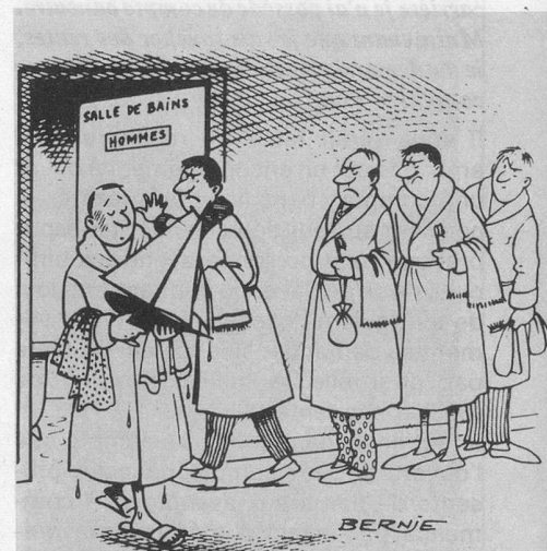
Sans paroles (Dessin de Bernie-Cosmopress)

Les personnes âgées non soumises à l'obligation d'assurance (celles qui ont un revenu plus élevé que les précitées) ne peuvent s'assurer que si elles en font la demande: