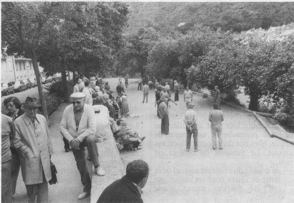
Au bord du Tech, chaque jour, la pétanque...

Je m'acquitterai du montant de la facture qui me sera envoyée avec un bulletin de versement, au moins 3 semaines avant le jour du départ.