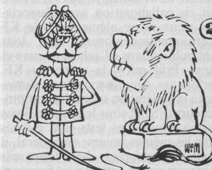
Sans paroles. (Dessin de Moese-Cosmopress.)