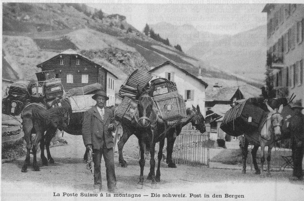
La Poste Suisse à la montagne — Die Schweiz. Post in den Bergen