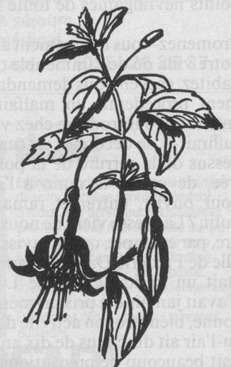
Fuchsias : rabattre les tiges à quelques centimètres.