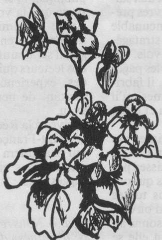
Bégonias : attendre la brûlure de la 1 re gelée.