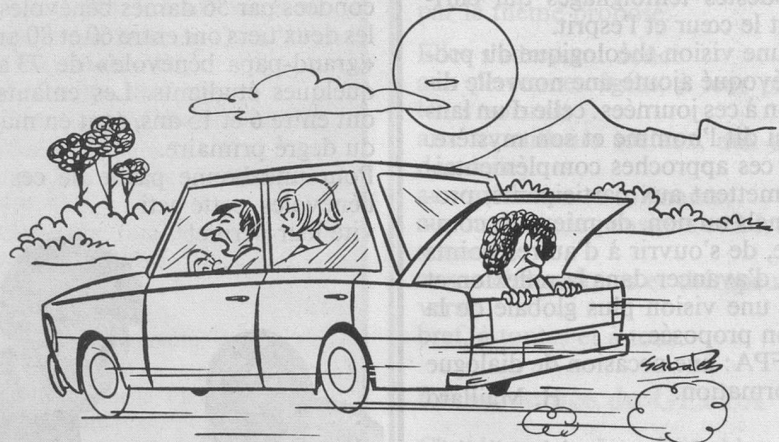
— Je t'ai dit plusieurs fois d'éviter d'emmener ta mère quand elle a mangé de l'ail... (Dessin de Ramon Sabatès)

En outre, pour la deuxième fois, Pro Senectute a organisé en septembre dans la région de Flims des vacances-excursions (en allemand Wanderferien). Gros succès et toute bonne expérience avec vingt-cinq participants(tes) et, comme de bien entendu, le traditionnel bilinguisme biennois. E. H.