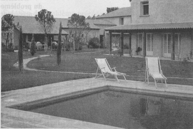
L'hôtel « Le Paradou ».

Inscriptions par écrit à Wagons-Lits Tourisme, Gare CFF, 1003 Lausanne, tél. 021/20 72 08.