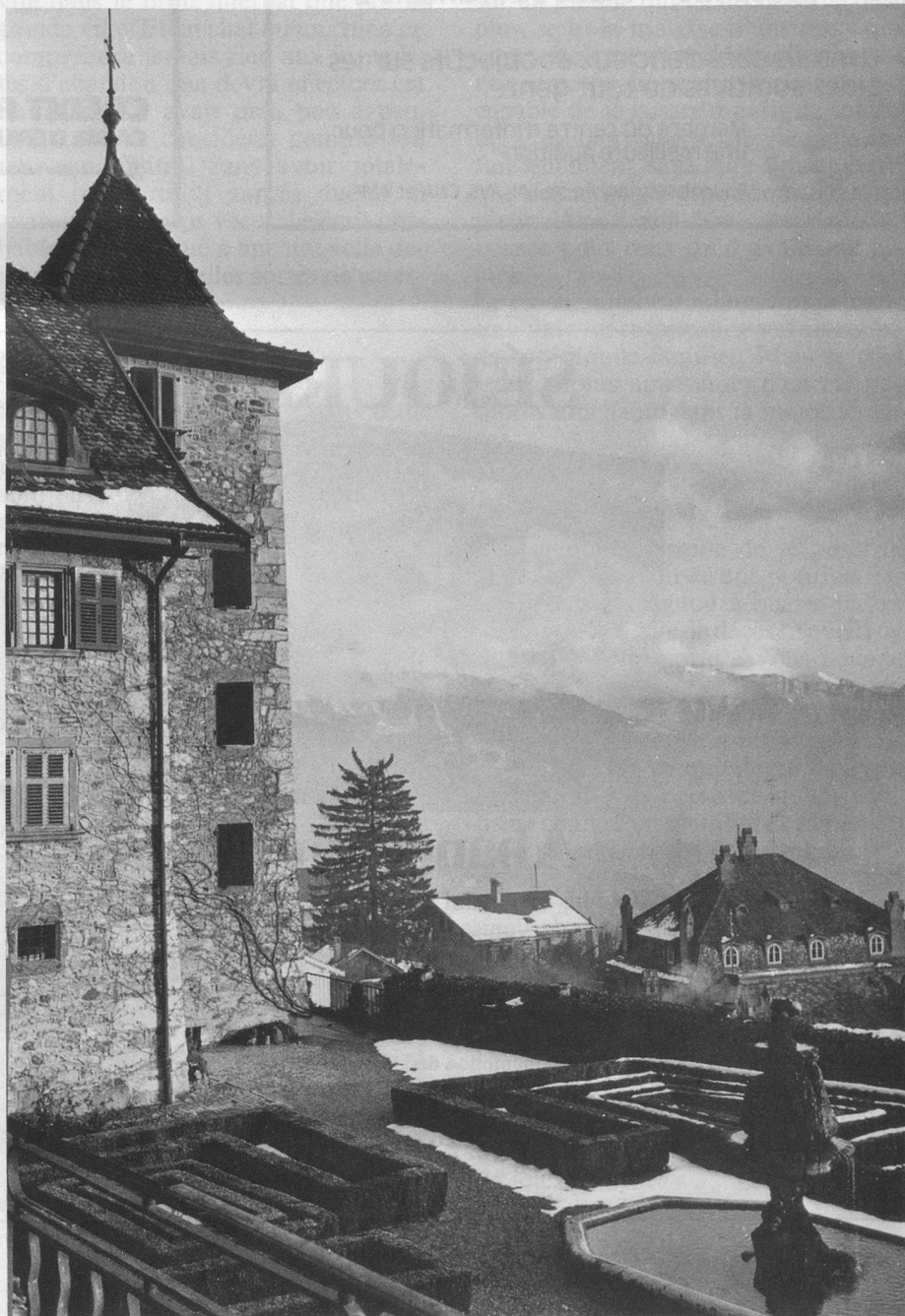
Dans le château de Chardonne, un institut de géobiologie.