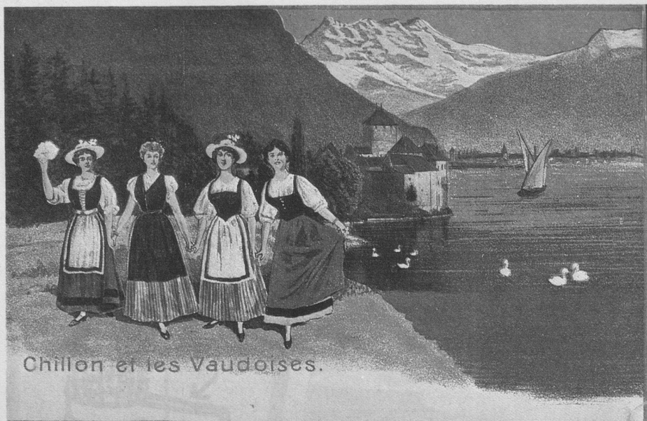
Chillon et les Vaudoises.