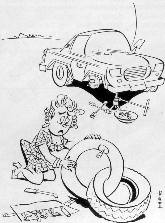
Sans paroles (Dessin de Facke-Cosmopress)