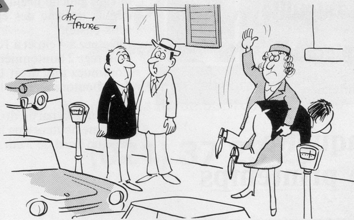
— Quand elle en arrive là, c'est qu'elle n'a plus de carnet de contraventions... (Dessin de Faure-Cosmopress)