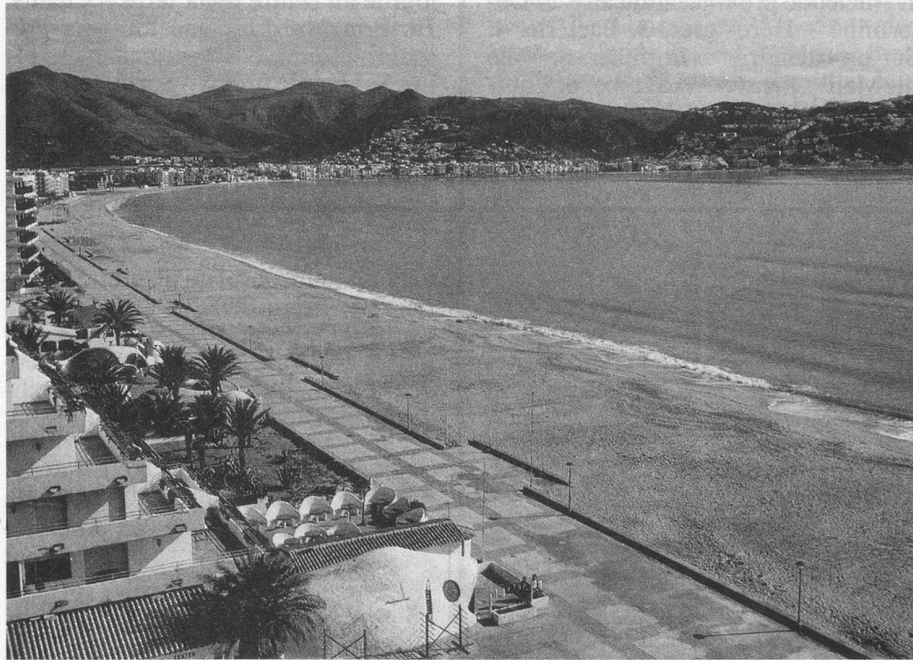
La plage de Rosas.

Pour remplacer nos précédents séjours à Salou à la suite de la vente de l'hôtel qui a accueilli nos voyageurs pendant