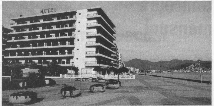
Hôtel Monte-Carlo Rosas