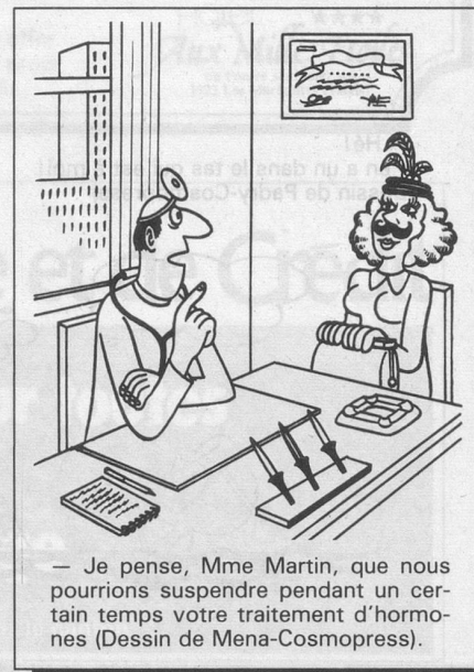
— Je pense, Mme Martin, que nous pourrions suspendre pendant un certain temps votre traitement d'hormones (Dessin de Mena-Cosmopress).

Le changement de statut automatique, appliqué depuis le 1 er janvier 1985, avait cependant pour conséquence