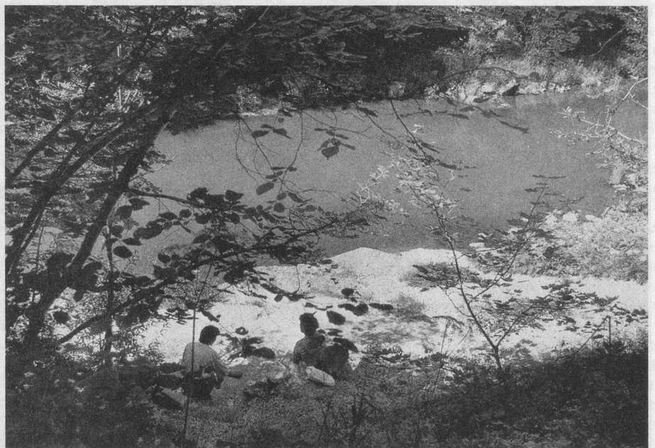
Le Doubs, frontière et site idyllique.

En 1968, à 63 ans, il décide de rentrer au pays. Il laisse son affaire de laiterie à l'une de ses filles. M. Cosandier veut que celle-ci débute dans les meilleures conditions possibles; elle le dédommagera comme elle pourra... Alors il arrive en Suisse avec quelques billets de cent francs. Il parcourt les environs de La Chau-de-Fonds et tombe en arrêt devant les deux bicoques du Châtelot, jadis lieux de rassemblement de contrebandiers. Tout est à refaire, tout tombe en ruines. Grâce à l'aide d'une banque qui lui fait confiance, il achète,