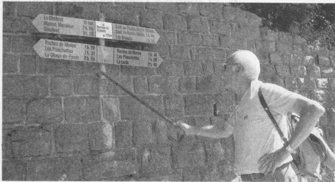
Un paradis pour les marcheurs.