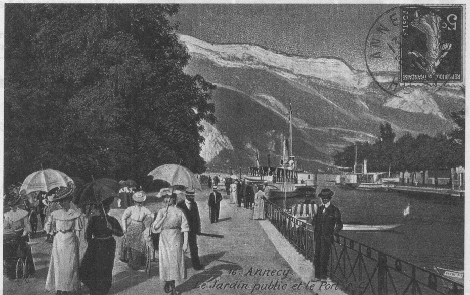
16. Annecy. Le Jardin public et le Port.

En cartophilie pure, la France a produit des sujets magnifiques au début de ce siècle. C'est probablement le pays qui a sorti les cartes postales les plus instructives, représentant quasiment toutes les phases de la vie. J'ai un faible pour les cartes représentant les petits métiers oubliés que l'on trouve en masse, comme les épouilleuses, les rebouteurs, les arracheurs de dents, les montreurs d'ours, les marchands de cheveux, etc.