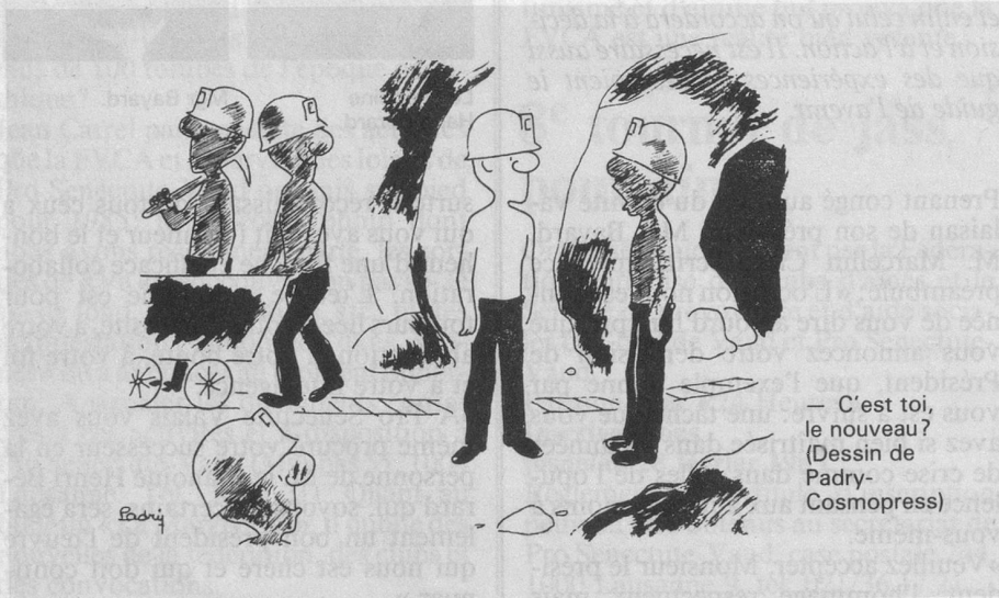
— C'est toi, le nouveau? (Dessin de Padry-Cosmopress)

Une nouvelle fois, six leçons pour débutants(tes) seront données durant six mardis de suite aux Prés-d'Orvin. Départ de Bienne à 11 h. Coordonnées utiles habituelles. Pro Senectute, rue du Collège 8, tél. 22 20 71.