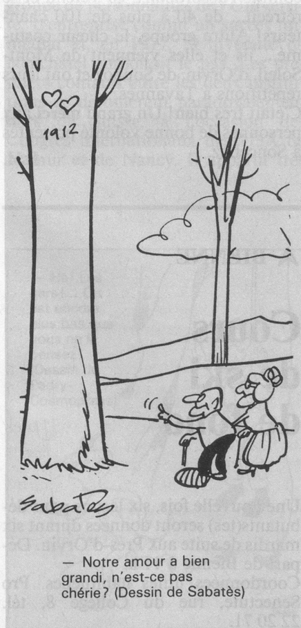
— Notre amour a bien grandi, n'est-ce pas chérie? (Dessin de Sabatès)