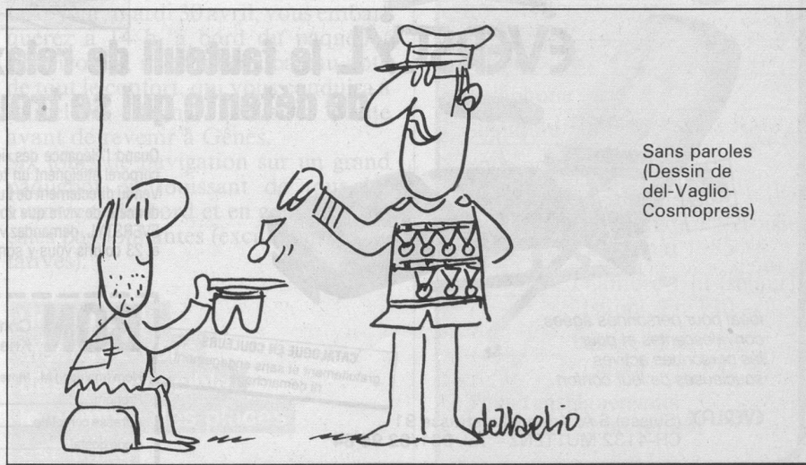
Sans paroles (Dessin de del-Vaglio- Cosmopress)

Avec ces changements, les banques suisses veulent faire de la carte eurochèque un «compte bancaire en poche».