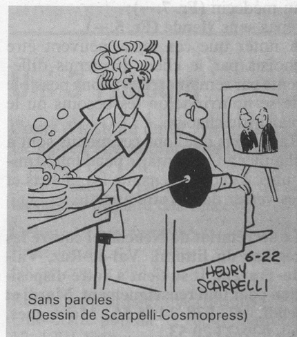
Sans paroles (Dessin de Scarpelli-Cosmopress)

Le dimanche matin dès 9 h., trois responsables préparent les tables, s'affairent et s'entendent avec le restaurateur-cuisinier. Vers 11 h. les autres aides viennent pour la cuisine, le buffet, le service et l'inévitable «relavage» et la mise au propre du local. Prix d'un repas: Fr. 8.— y compris thé, café, eau minérale et dessert. Un verre de rouge, Fr. 1.—. Qui dit mieux? Faites un essai. C'est vraiment très sympa. Tél. 22 20 71. E.H.