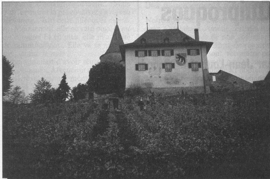
Le Château d'Erlach.

noir daigne entrouvrir des yeux jaunes et une gueule rose avant de se rendormir béatement.