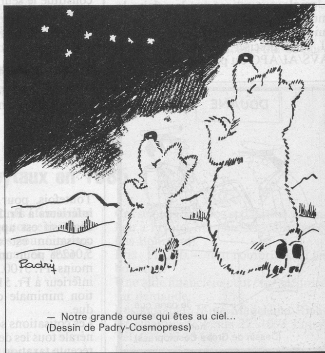
— Notre grande ourse qui êtes au ciel... (Dessin de Padry-Cosmopress)