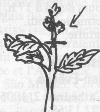
Ebourgeonnage d'un dahlia.

tous les quinze jours, contre les pucerons et les maladies cryptogamiques. Ebourgeonnez les dahlias en pinçant la