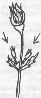
Eboutonnage d'un rosier.

Eboutonnez vos rosiers pour obtenir des fleurs plus grosses. Éliminez les gourmands et traitez préventivement,