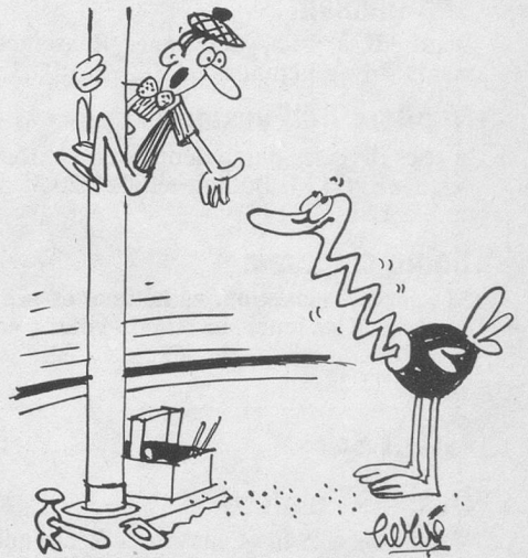
— J'ai dit: passe-moi simplement le mètre pliant! (Dessin de Hervé-Cosmopress)